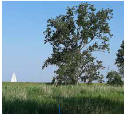
Küstenrundfahrt im Inselnorden