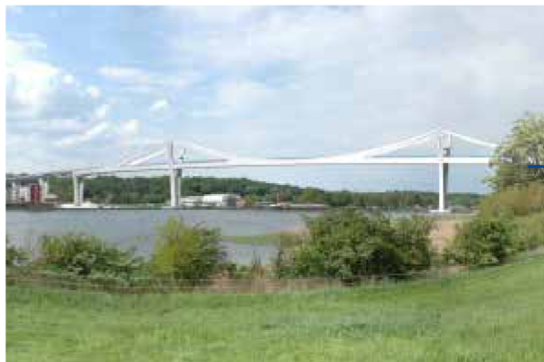
Über neue Brücke und durch einen Tunnel